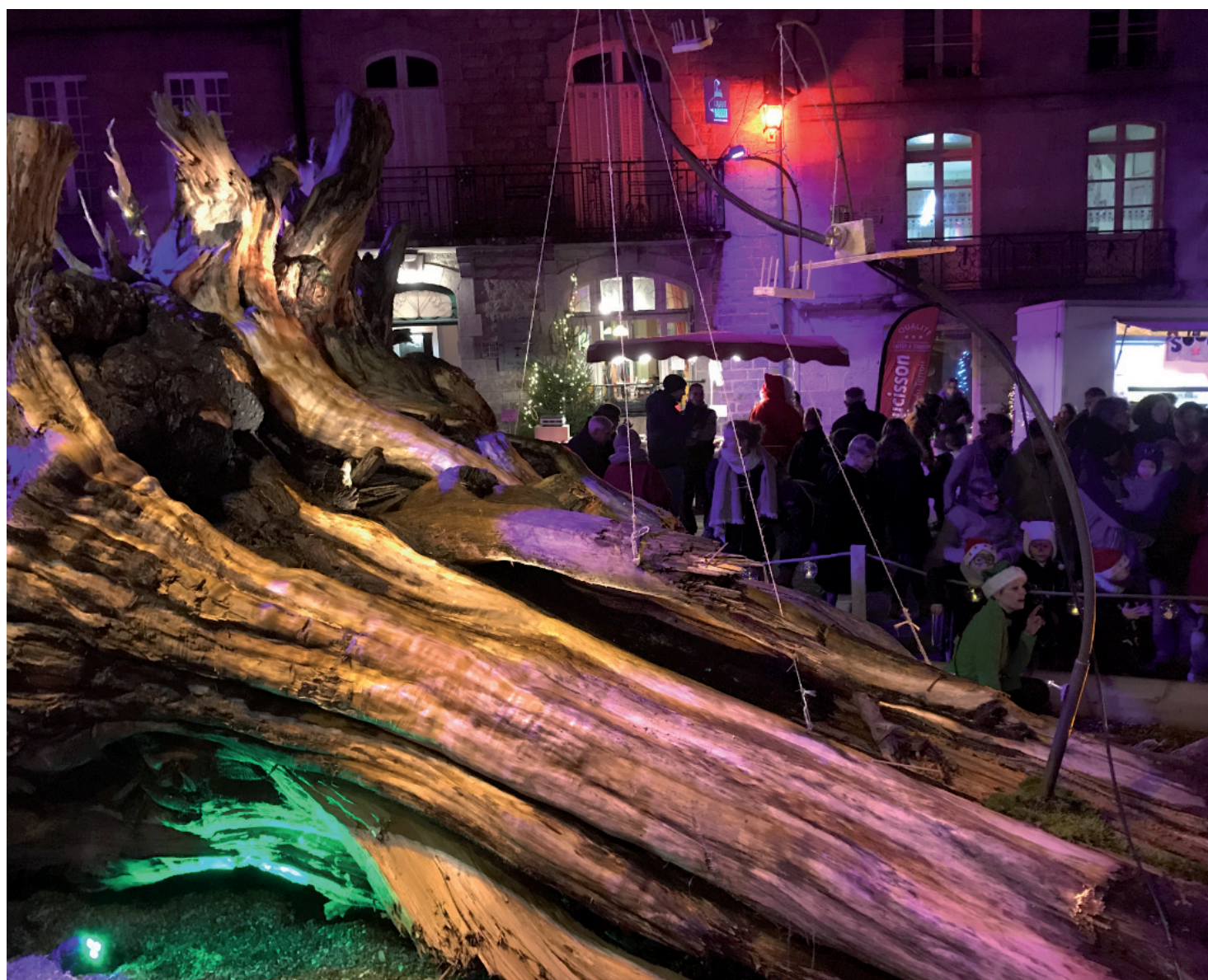
Mardi 19 décembre, « Marché de Noël » « Place Penthievre » organisé par l'Union des Commerçants et mise en lumière par l'association A.C.E.D.A.M.